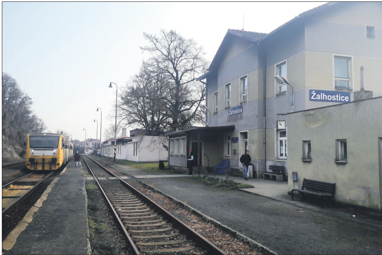
Velké proměny dozná zejména stanice Žalhostice, kde se vybudují především nová nástupiště.

V rámci stavby dojde ke komplexní modernizaci úseků Žalhostice – Litoměřice cihelna a Litoměřice horní nádraží – Liběšice, kde se poté zvýší