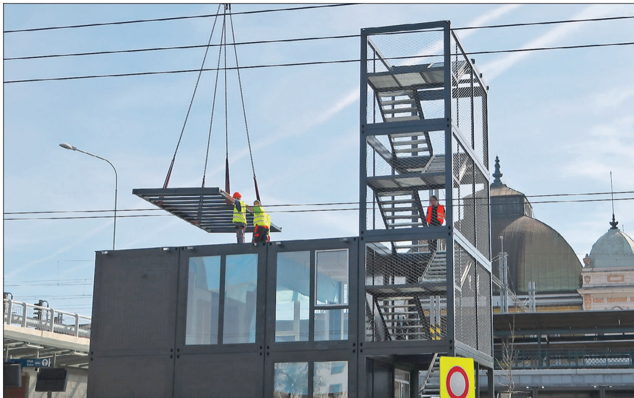
Z vyhlídkové plošiny bude vidět mumraj na nádraží i střed města.

Atypický komplex složený z kontejnerových modulů vyrůstá na dřívě zanedbané ploše ohraničené drážním tělesem, sousedním autobusovým terminálem, Sirkovou a Šumavskou ulicí. „Modulový stavební systém jsme zvolili, protože jeho výhodou je snadná montáž, lze měnit funkce jednotlivých částí a ty lze opětovně využít na jiném místě,“ uvedl náměstek plzeňského primátora Pavel Šindelář (ODS). Jedná se totiž o dočasné řešení, než se najdou peníze na trvalou zástavbu. „S ní počítají dlouhodobé územní a rozvo-