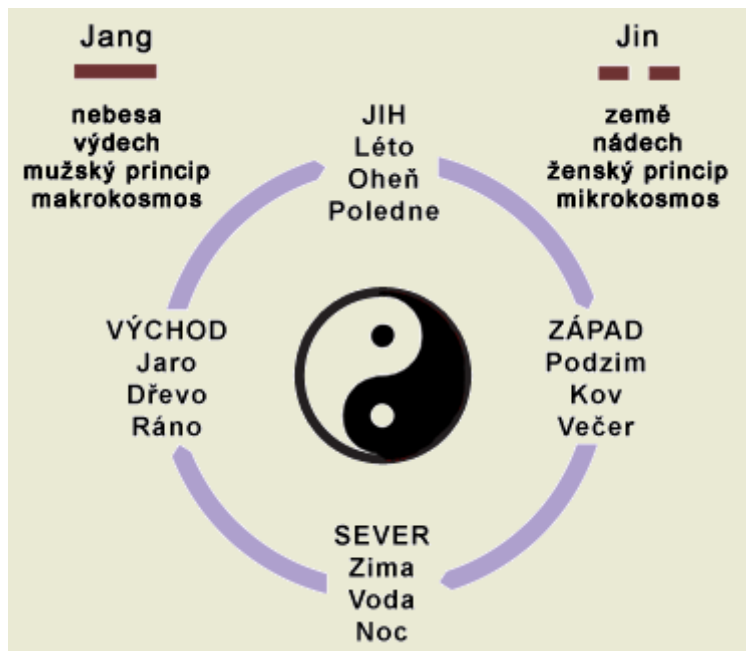
Obr.: Jin-jang. In: Cesta tantry. Tantrické masáže, spiritualita, sexualita . Dostupné z: http://tantra-masaze.blogspot.com/2013/08/jaky-je-rozdil-mezi-taoismem-tantrou.html

Kdo se vměšuje, nikdy nemůže získat svět."